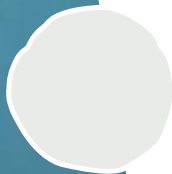
Hier verwendet: Kalkweiß